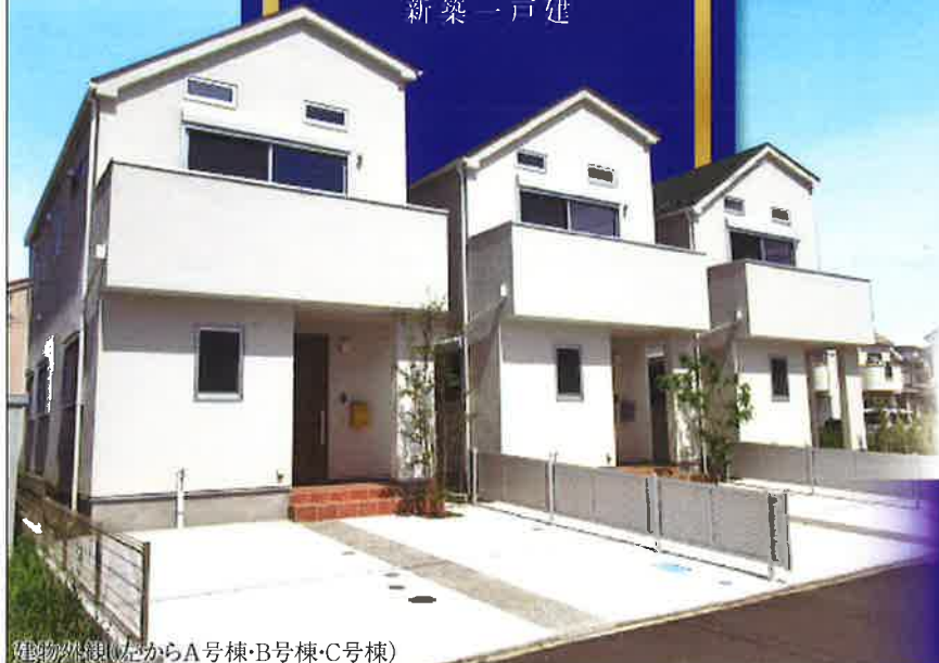
建物外観(左からA号棟・B号棟・C号棟)