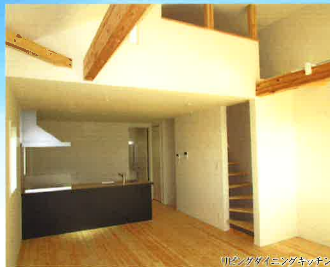
リビングダイニングキッチン